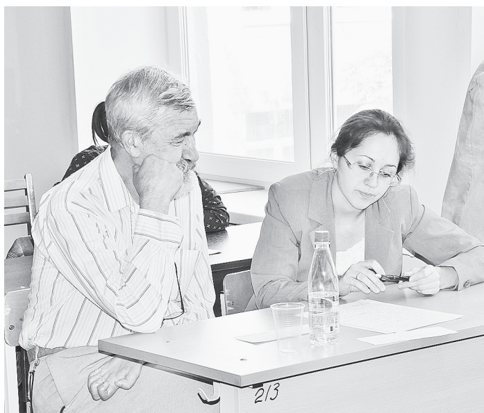
Выпускные экзамены сдают математики