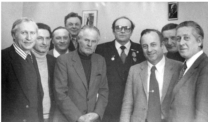
Сотрудники кафедры высокомолекулярных соединений с заведующим кафедрой В.А. Кабановым

В 1958 г. В.А. Каргин и А.В. Топчиев, одни из первых в мире, опубликовали работу по термическим превращениям полиак-