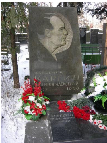
Могила В.А. Каргина на Новодевичьем кладбище

Каргина) в память о В.А. Каргине, где прошли его детские и юношеские годы, установлена мемориальная доска. В 1992 г. на базе Тверского государственного университета создан Общественный региональный фонд им. академика В.А. Каргина. Начиная с 1994 г. в Твери ежегодно проводятся