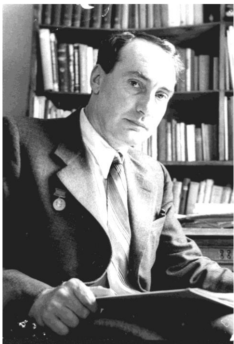
В Карповском институте