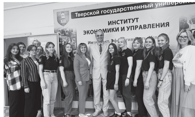
С волонтерами приемной кампании

– Вопрос простой, но ответ неоднозначный. Действительно, когда порог нашего университета переступили и влились в наш дружный коллектив 2000 новых обучающихся, разве это можно оценить иначе, нежели словом «замечательно»? С другой стороны, есть еще резервы для улучшения нашего взаимодействия со школьниками Тверской области, для повышения эффективности профориентационной работы. В конечном итоге есть еще возможность увеличить количество