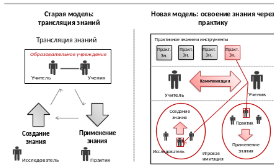
Рис.4. Представления о способе реализации нового формата образования