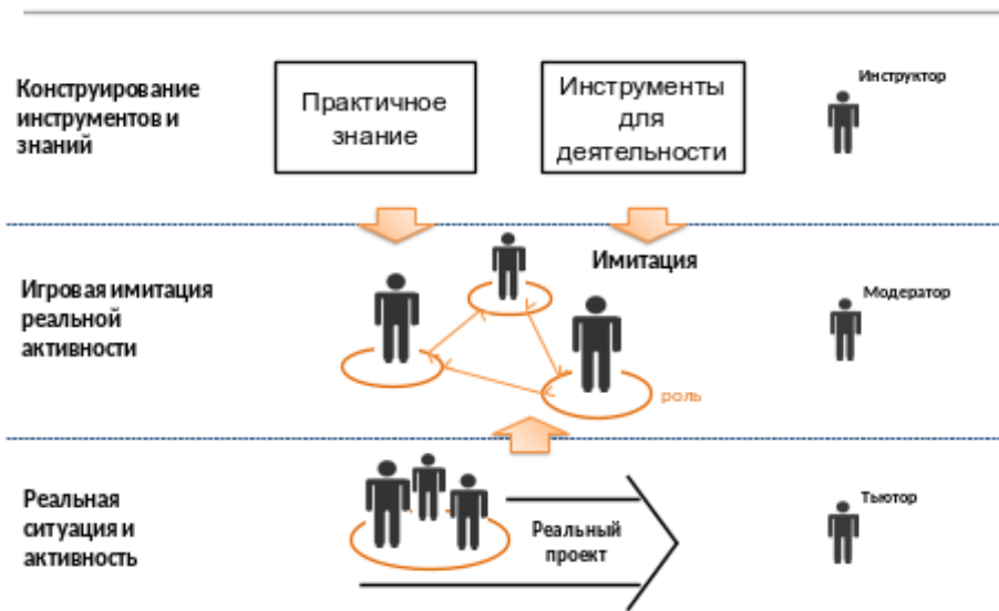
Рис. 5. Представления о способе реализации игры как форме сочетания всех возможностей в образовании

Пользуясь данными фрагментами презентации, а также используя поисковую деятельность в сети Интернет, докажите, что образовательные учреждения России, ближнего и дальнего зарубежья реализуют в своей деятельности указанные направления новой образовательной модели.