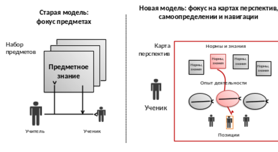
Рис.4. Представления о способе реализации нового содержания образования