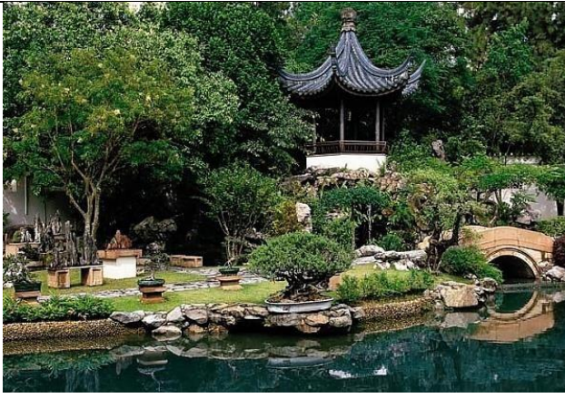
Рис. 1. Сад в китайском стиле