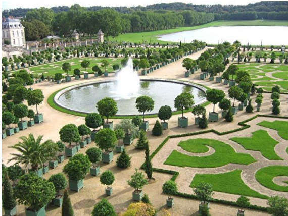
Рисунок. Садово-парковый ансамбль Версаля

Рассмотрите рисунок. Укажите тип садово-паркового ансамбля. Ответ поясните.