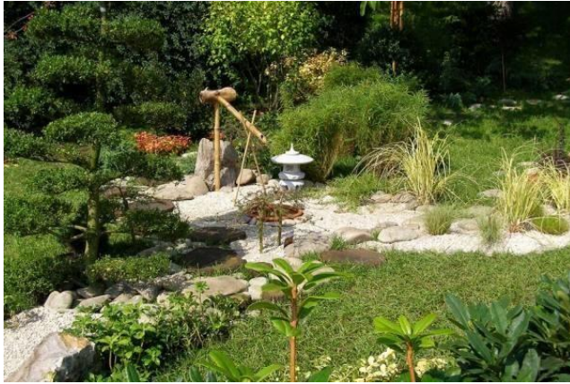
Рис. 2. Японский садик