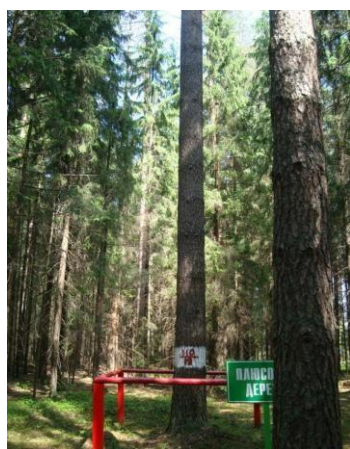
Рис. 2 – Плюсовое дерево (сосна обыкновенная, Нижегородская область)

Отбор плюсовых деревьев и насаждений проводят в два приема. Сначала специалисты лесхозов отбирают кандидатов в плюсовые деревья и на-