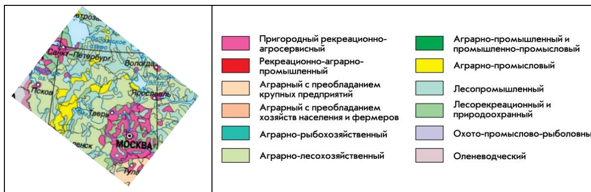
Рис. 1. Фрагмент карты «Типы сельской местности» в Национальном атласе России (т. 3, 2008. С. 136–137). URL: http://xn--80aaaa1bhncclci1c15c4ep.xn--p1ai/cd3/136-137/136-137.html