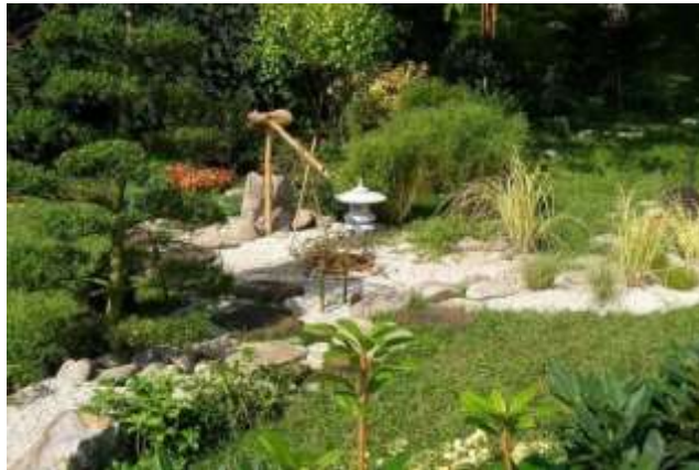
Рис. 2. Японский садик