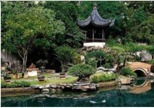
Рис. 1. Сад в китайском стиле