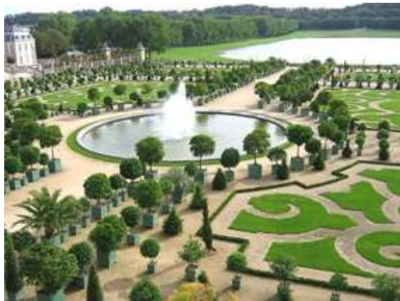
Рисунок. Садово-парковый ансамбль Версаля

Рассмотрите рисунок. Укажите тип садово-паркового ансамбля. Ответ поясните.