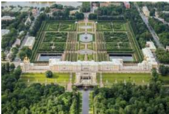
Рис. 1. Садово-парковый ансамбль Петергофа