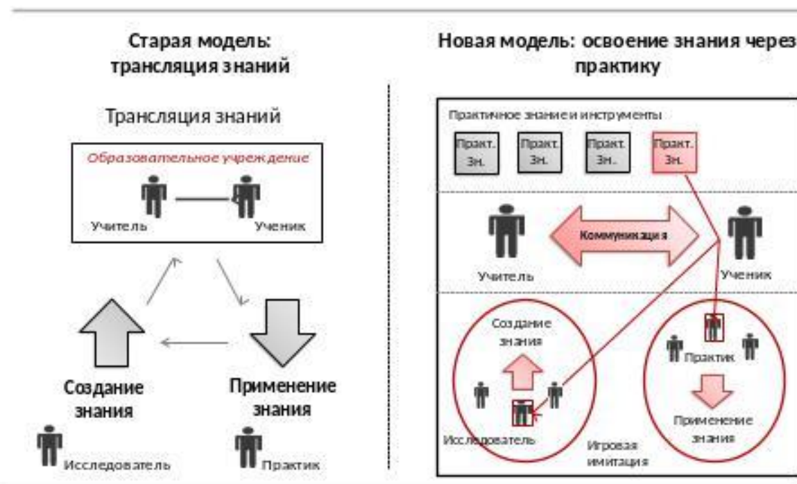
Рис.4. Представления о способе реализации нового формата образования