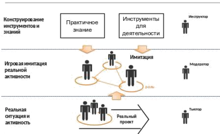
Рис. 5. Представления о способе реализации игры как форме сочетания всех возможностей в образовании

Пользуясь данными фрагментами презентации, а также используя поисковую деятельность в сети Интернет, докажите, что образовательные учреждения России, ближнего и дальнего зарубежья реализуют в своей деятельности указанные направления новой образовательной модели.