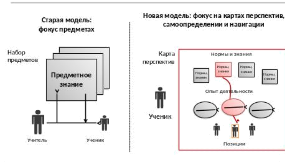
Рис.4. Представления о способе реализации нового содержания образования