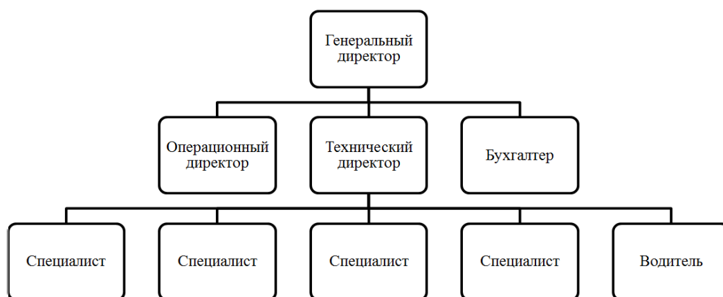
Рисунок 2 – Организационная структура управления ООО «Радар»

Специалисты занимаются непосредственно проведением монтажа, демонтажа, технического обслуживания, ремонта стоящего на балансе компании оборудования.»