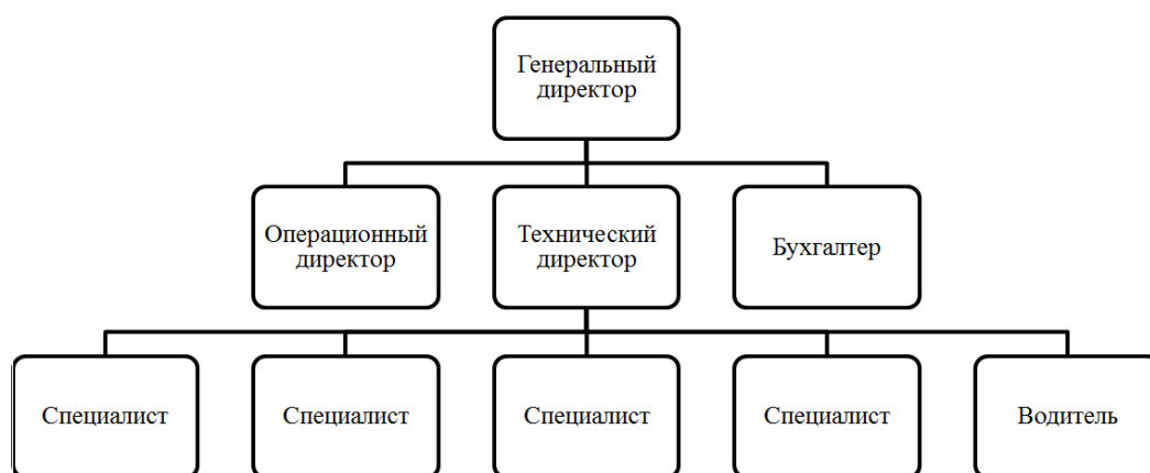
Рисунок 2 – Организационная структура управления ООО «Радар»

Специалисты занимаются непосредственно проведением монтажа, демонтажа, технического обслуживания, ремонта стоящего на балансе компании оборудования.»