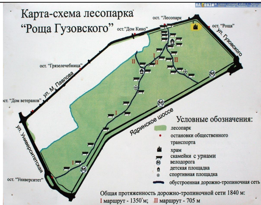
Рисунок. Карта-схема лесопарка «Роша Гузовского»