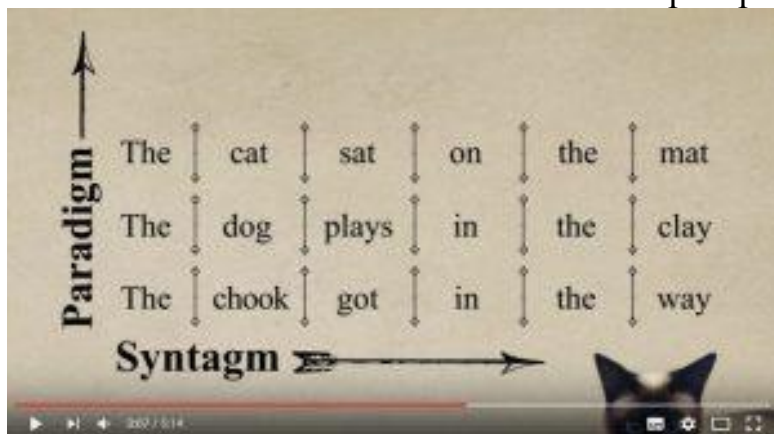
Рис 1. Кадр из видео-обзора курса Фердинанда де Соссюра

Сочетания словоформ (т. е. грамматических форм слов), сочетания морфем, сочетания частей предложения, сочетания слов — это синтагмы. Синтагма есть правильная комбинация взаимодействующих знаков, формирующих осмысленное целое (нечто, называемое “цепью”). Например, нельзя сказать «Дай мне белый бумагу», только: белую бумагу . Параграфы и главы также являются синтагмами. Синтагмы создаются посредством выбора парадигм из тех, которые конвенционально отнесены как уместные или приемлемые, или которые могут требоваться некоторым правилом системы (например, грамматикой). На фотографии или в живописи синтагматические отношения являются пространственными.