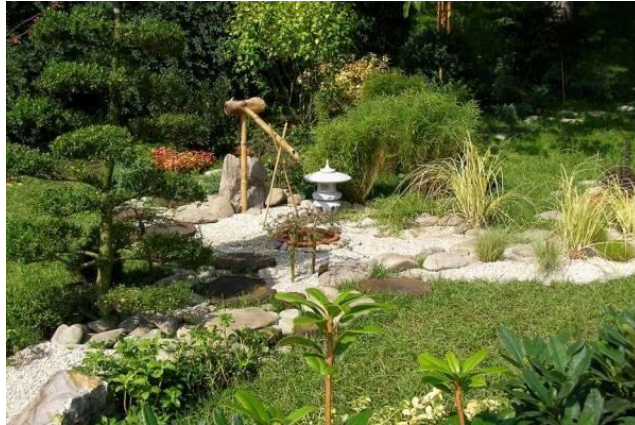
Рис. 2. Японский садик